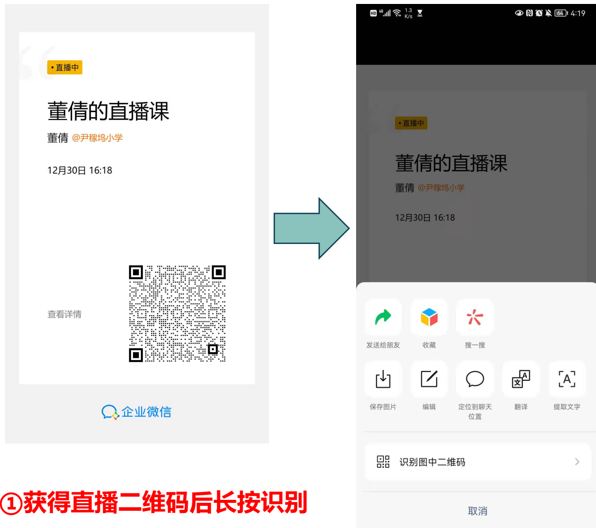
①获得直播二维码后长按识别