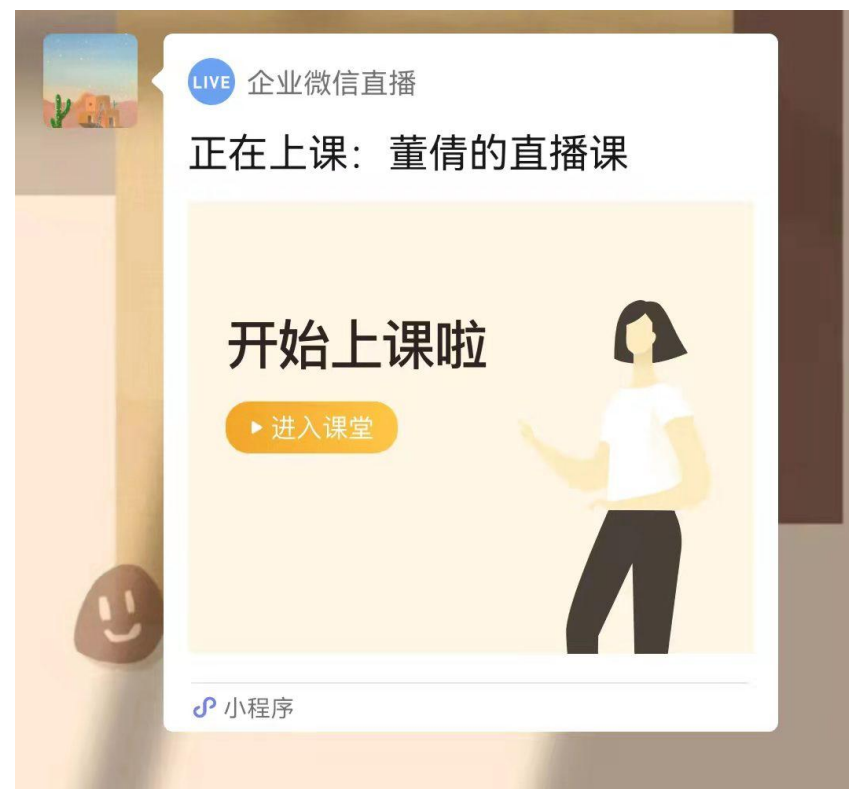
②获得直播链接后点击进入